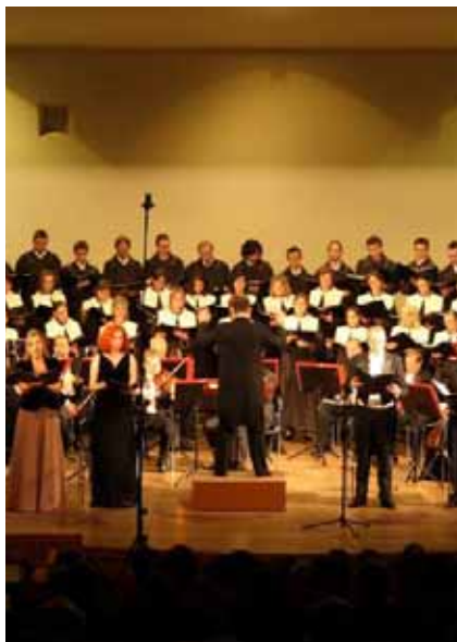
Chór Uniwersytetu Przyrodniczego