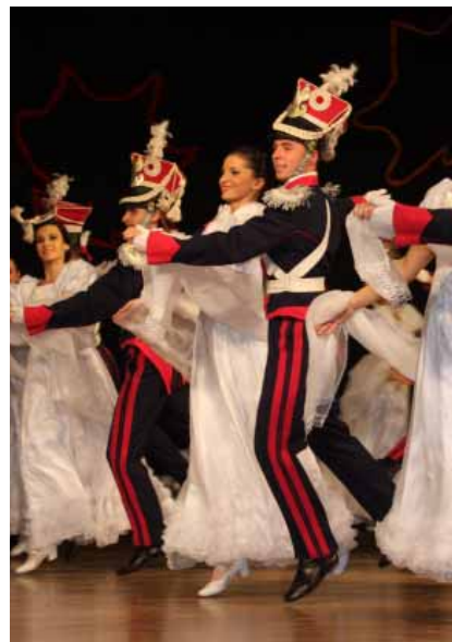
Zespół Pieśni i Tańca UP JAWOR