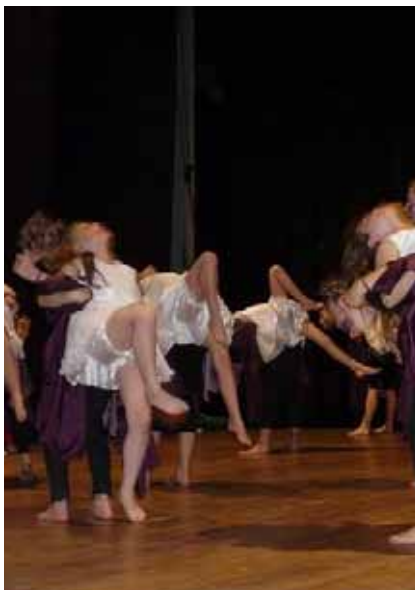
Zespół Tańca Współczesnego ARABESKA